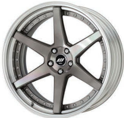
トランスグレーポリッシュ・TGP SR 21 (ディープコンケイブ)