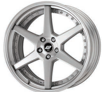
ブラッシュド・BRU SR 20 (セミコンケイブ)