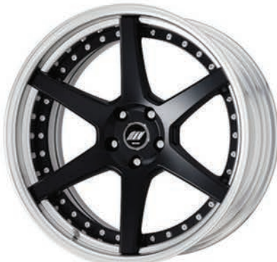
マットブラック・MBL SR 20 (ミドルコンケイブ)